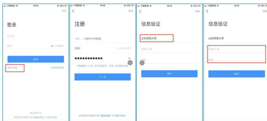
图 2 注册—信息验证流