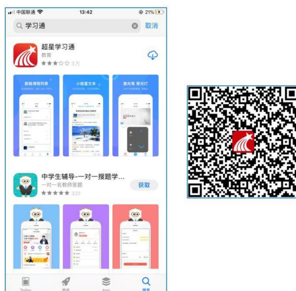
图 1 下载“学习通”