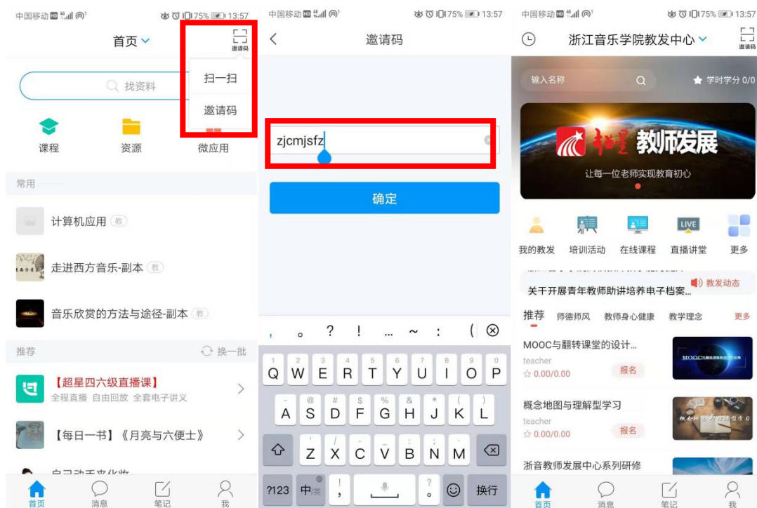
图 3 邀请码输入流程

1. 进入教师发展中心平台。登录成功后，打开学习通，在首页右上角点击“扫一扫”图标，选择邀请码，进入邀请码输入界面，输入邀请码“zjcmjsfz”则可进入教师发展中心平台。