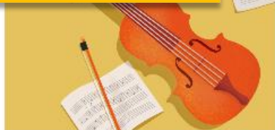
音乐英语 Music English